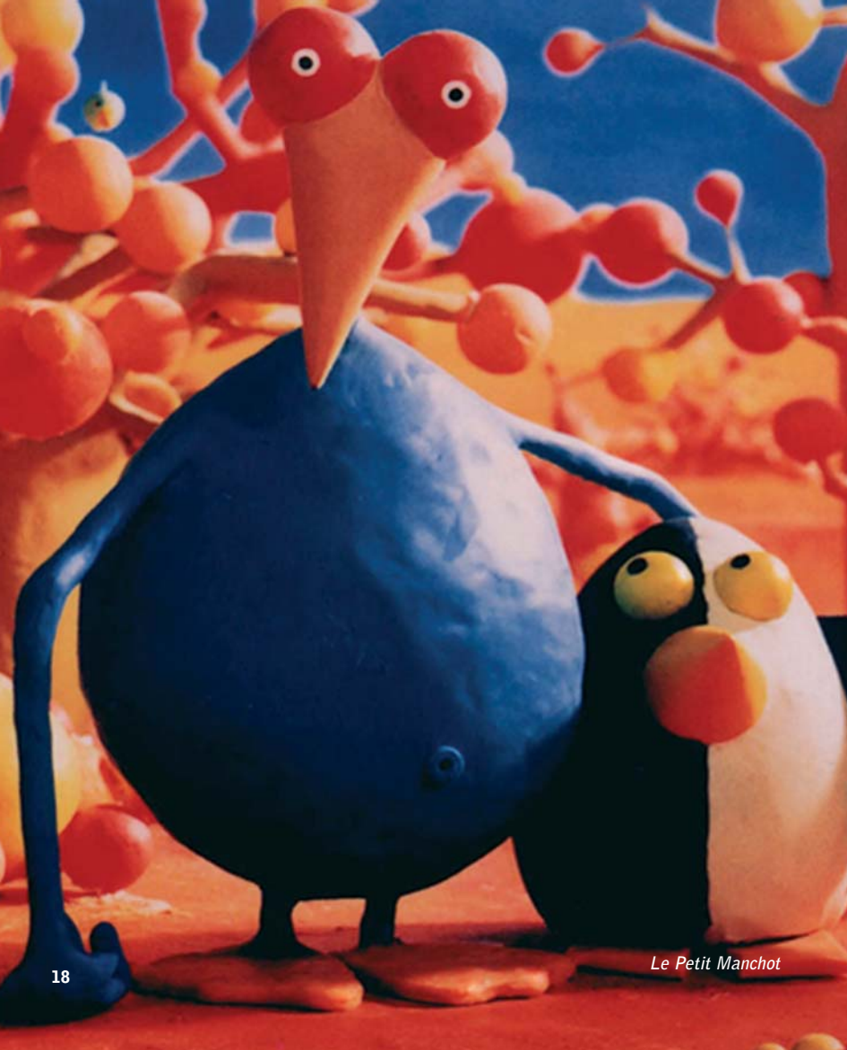
Le Petit Manchot