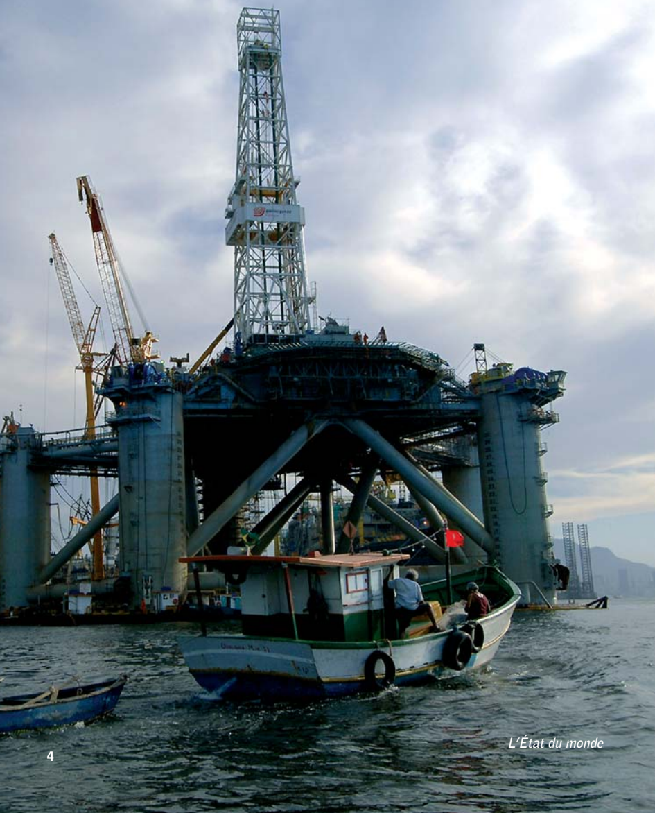
L'État du monde