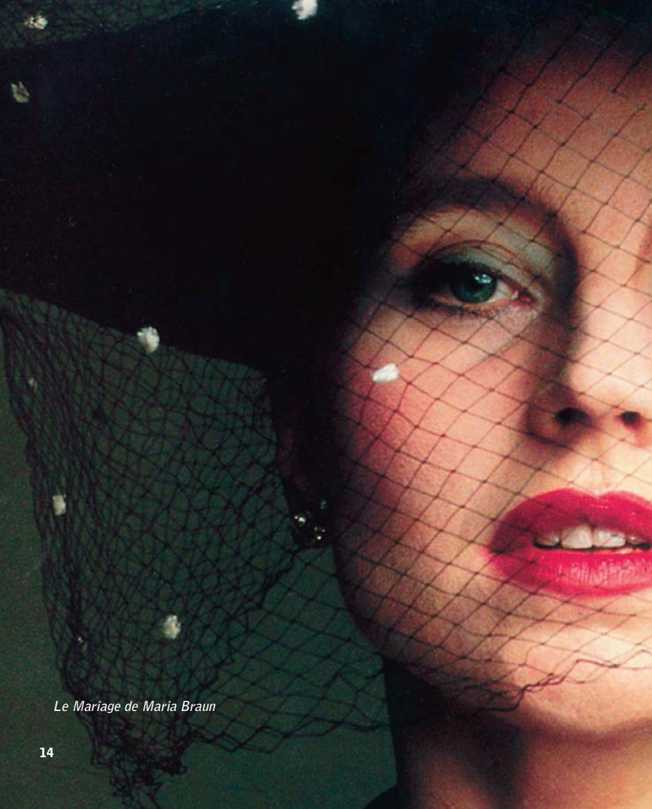
Le Mariage de Maria Braun